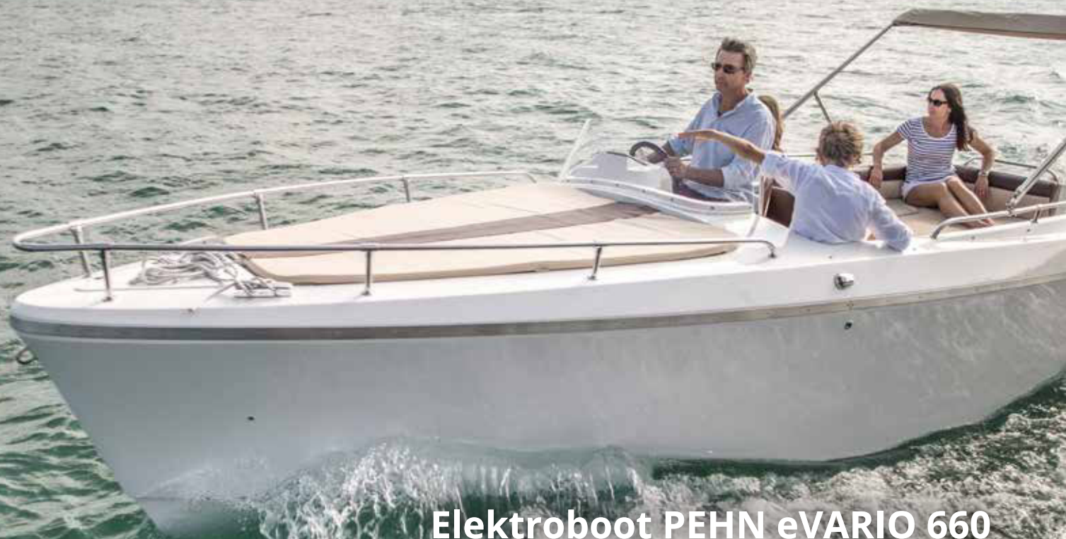
Elektroboot PEHN eVARIO 660